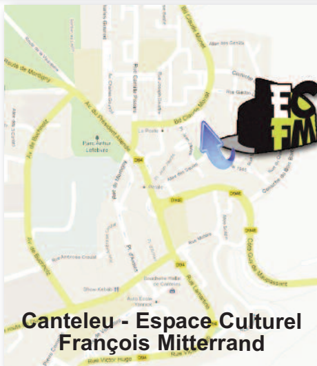
Canteleu - Espace Culturel François Mitterrand