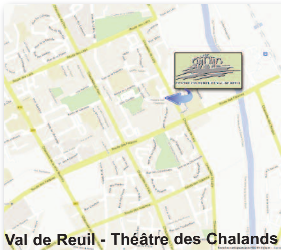
Val de Reuil - Théâtre des Chalands